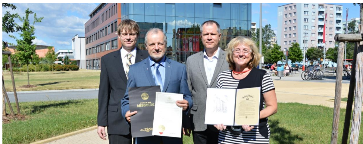
Guvernér státu Missouri ocenil spolupráci s Jihočeskou univerzitou.

V rámci interní formy studia DSP na EF je povinný požadavek zahraniční stáže, pro vybrané studenty jsou otevřeny programy v USA (University of Missouri, Savannah State University).