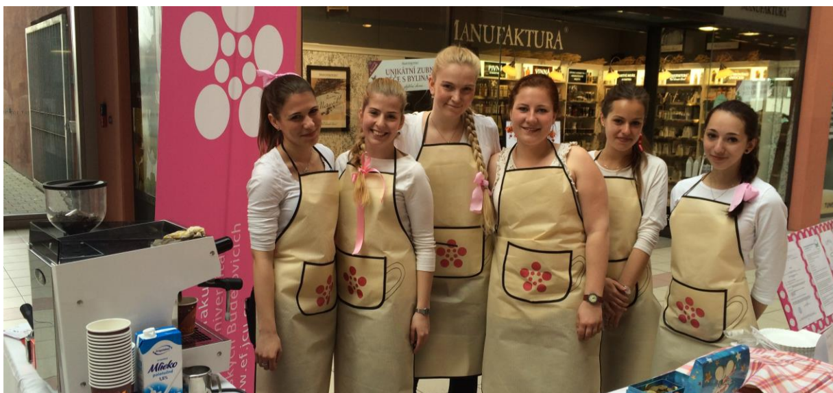
Projekt CoffeePoint.

Dále Ekonomická fakulta JU spolu se svými studenty aktivně pokračovala v podpoře činnosti sociálních firem a činnosti neziskových organizací. Příkladem může být projekt „CoffeePoint“, prodej kávy a jemného pečiva, jehož výtěžek byl věnován na dobročinné účely, nebo studentský projekt „Reverzní logistika hliníkových obalů“, jehož účelem je vybrat co nejvíce hliníkových obalů a různého hliníkového materiálu, který se následně vykoupí a celý výtěžek bude věnován útulku Animal Rescue. Na projektu se podílí i sdružení Na hnízdě, které společně se studenty vybírá hliník v Menze JU, Akademické knihovně JU, na Zemědělské a Přírodovědecké fakultě JU. Dále jsou sběrná místa na všech kolejích a v budovách fakult.