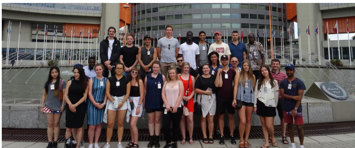
Letní škola 2017.

V roce 2017 poprvé začali studenti studovat anglickou mutaci doktorského studijního programu s názvem Management and Business Economics (přijati byli 4 studenti).