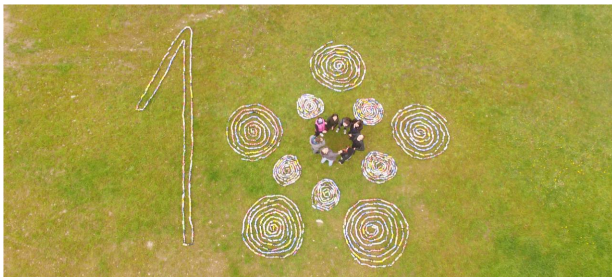
Projekt „Reverzní logistika hliníkových obalů k výročí 10 let EF“.