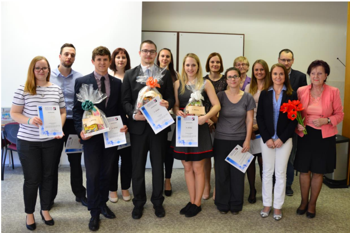
Soutěž SVOČ na Ekonomické fakultě JU