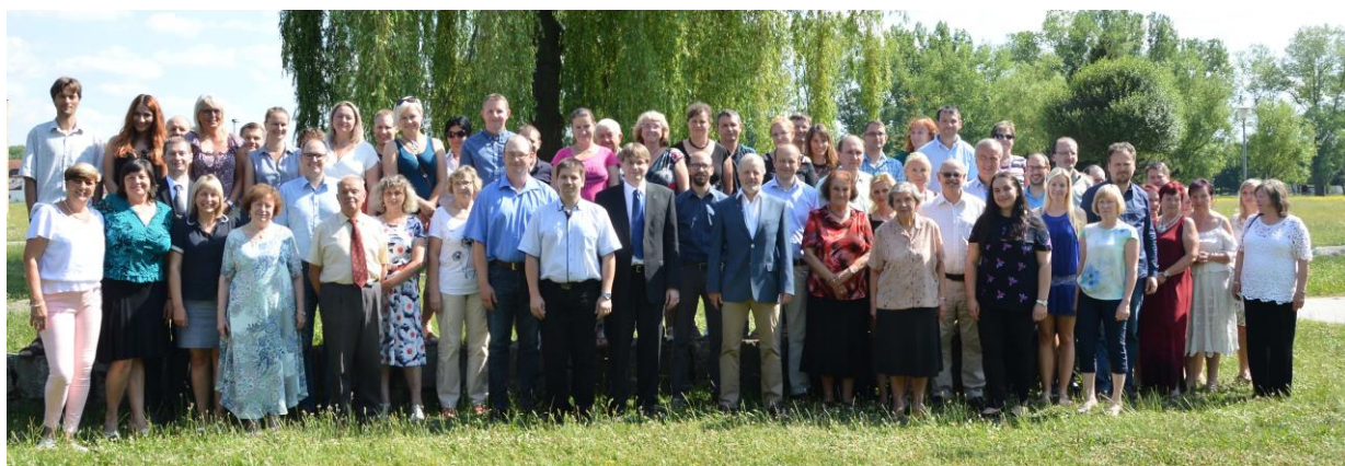
Setkání zaměstnanců 2017.

V současné době se mohou zaměstnanci i studenti obrátit na Etickou komisi JU, která se problematikou sexuálního a genderově podmíněného obtěžování zabývá a konkrétní případy řeší.