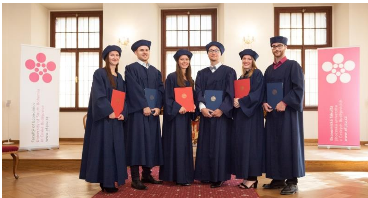
První absolventi mezinárodního studijním programu typu joint degree Regionální a evropský projektový management.

Ekonomická fakulta JU rovněž pořádá soutěže podnikatelských záměrů Invest Day, otevřené studentům všech fakult Jihočeské univerzity. Cílem soutěže je podpořit talentované studenty, otestovat jejich prezentační schopnosti a schopnost prodat svůj nápad investorům.