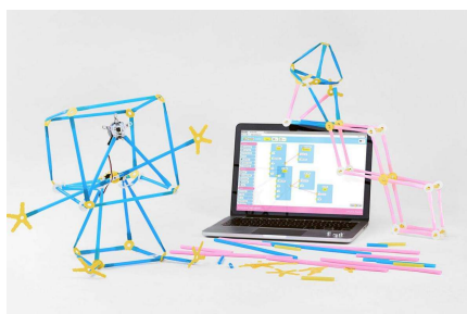
Švédská stavebnice Quirkbot